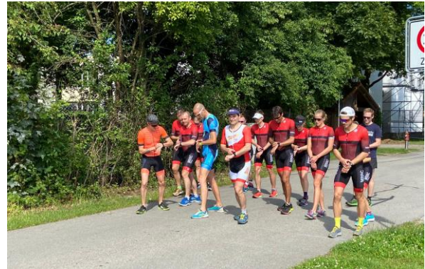
READY, SET, ...