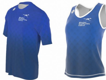
T-SHIRT UND SINGLET