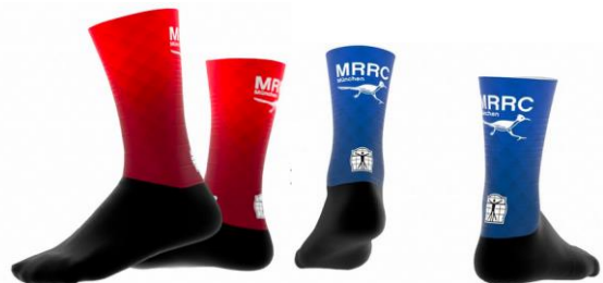
RAD- UND LAUFSOCKEN