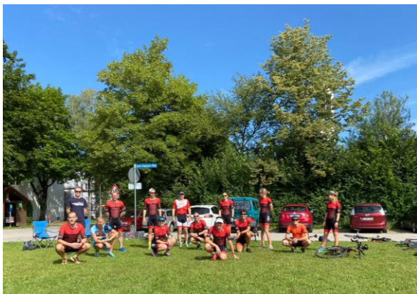
UNSER MRRC LIGATEAM